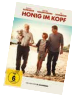
Film Honig im Kopf Til Schweiger, 2014