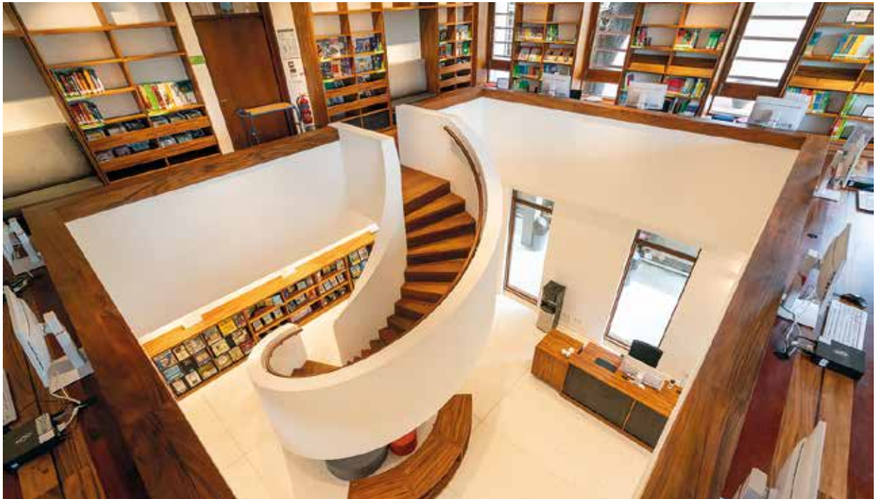
Innenansicht der Bibliothek

physischen Medienbestand bietet das Goethe-Institut die kostenlose Nutzung von ca. 35.000 Medien der Onleihe an. Die Einführung und Nutzung der Onleihe war eine Herausforderung für uns BibliothekarInnen, aber auch für unsere NutzerInnen. Es bestand keinerlei Erfahrung in der Nutzung eines solchen digitalen Angebots, und daher war bei den NutzerInnen auch eine große Unsicherheit festzustellen, die sich aber schon weitgehend gelegt hat. Inzwischen haben wir mit diesem Angebot ein Alleinstellungsmerkmal in unserem Land, und das Angebot wird immer stärker genutzt.