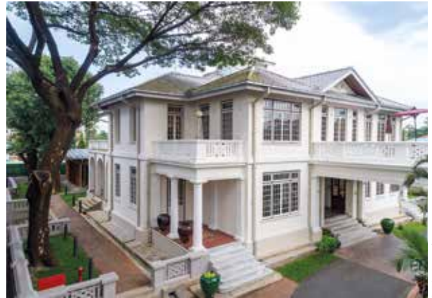
Goethe-Villa in Myanmar