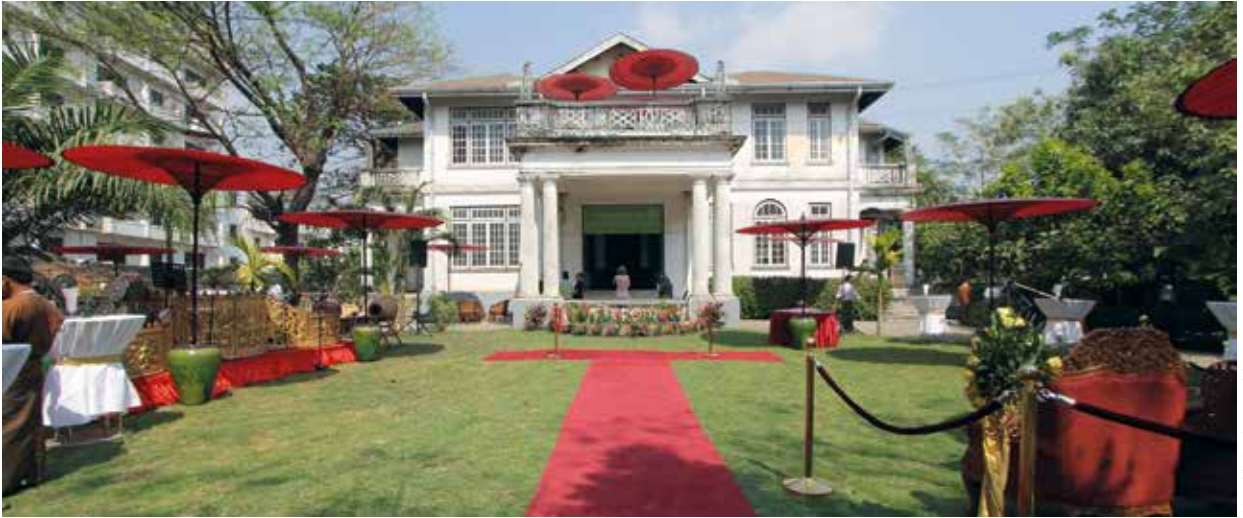
Eröffnung Goethe-Institut Myanmar

Außerdem ist das Goethe-Institut Mitglied der Namibia Information Workers Association (NIWA). Beide Mitarbeiter sind aktiv in den Gremien der Vereinigung vertreten. Oft finden Versammlungen der NIWA im Haus des Goethe-Instituts statt.